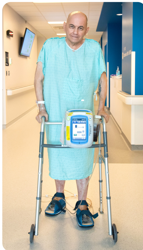
Le pansement à pression négative est lié à un appareil portatif.

Normalement, vous pourrez bouger vos membres et marcher tout de suite après l'opération. C'est possible grâce aux pansements à pression négative négative (système VAC). Ces pansements sont liés à un appareil portatif.