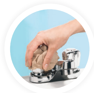
7. FERMER avec le papier