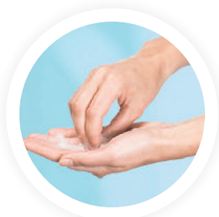
4. NETTOYER LES ONGLES