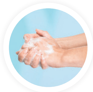
3. FROTTER de 15 à 20 secondes